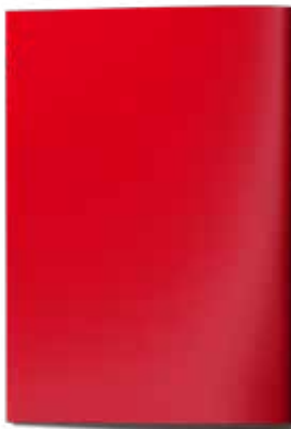
Anzeige 1/1 Seite U2/U3/U4 210 x 297 mm 4.500,00 EUR