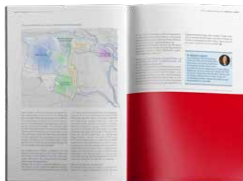
Anzeige 1/2 Seite 210 x 145 mm 1.700,00 EUR