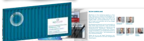
Beileger: lose beigelegt beispielsweise DIN-Lang, 6-Seiter (Spezifikationen auf Anfrage)