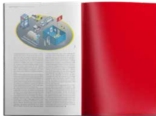
Anzeige 1/1 Seite 210 x 297 mm 3.000,00 EUR

Hamburger Sparkasse IBAN: DE88 2005 0550 1048 2156 59 BIC: HASPADEH3333